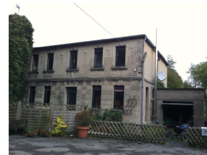
Bestand vor dem Umbau