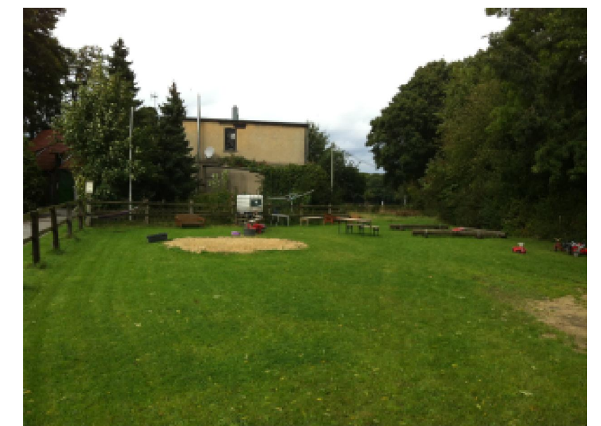
Aussengelände / Spielplatz